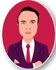
İşleyen Zeka Yayınları

Paragraftan çıkarılacak sonuç aşağıdakilerden hangisidir?